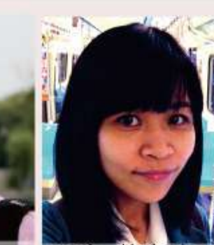
99年 蔡育真 淡水河流域渡口空間研究-103年完成