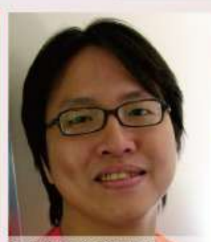
90年 蔡沛霖 台灣城隍廟的儀式空間之研究-92年完成