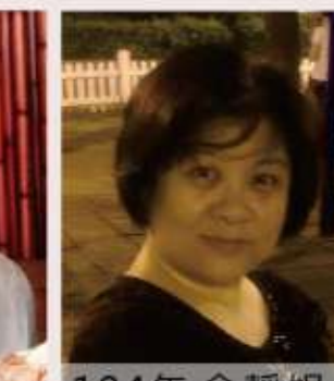
104年 余靜嫻 歷史住都會小學再利用策略探討-以臺北市永樂國小為例-108年完成