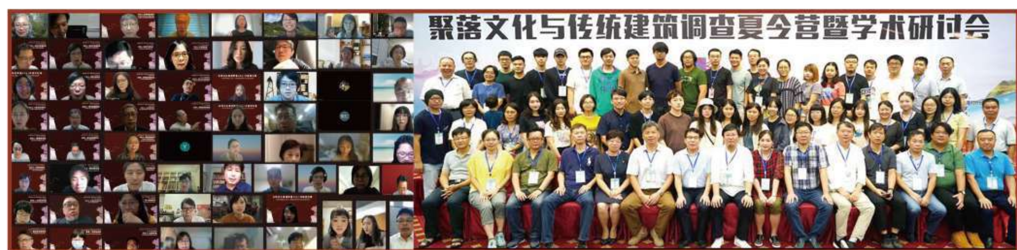
圖1 國際交流及參訪

2021 台灣文化資產學會2021年學術研討會 2020 文資游草2020 傳統建築·華山1914論壇 2019 工業遺產路徑建構的挑戰與實踐國際研討會 2019 閩東傳統聚落調查及工作營 2019 武漢大學暑期聯合設計工作坊 2018 兩岸大學生聚落文化與傳統建築調查夏令營暨學術研討會 2017 泉州廈門聚落與建築設計工作營