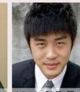
104年 陳聖元 日治時期台北建築變遷與歷史之關係-以《臺灣省志》資料庫為例-107年完成