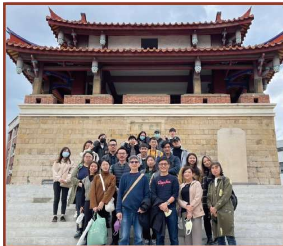
圖3 新竹迎曦門移地教學