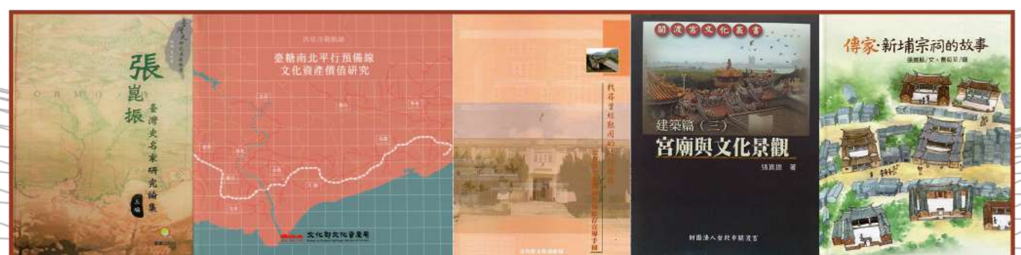
圖1 近年出版之專書