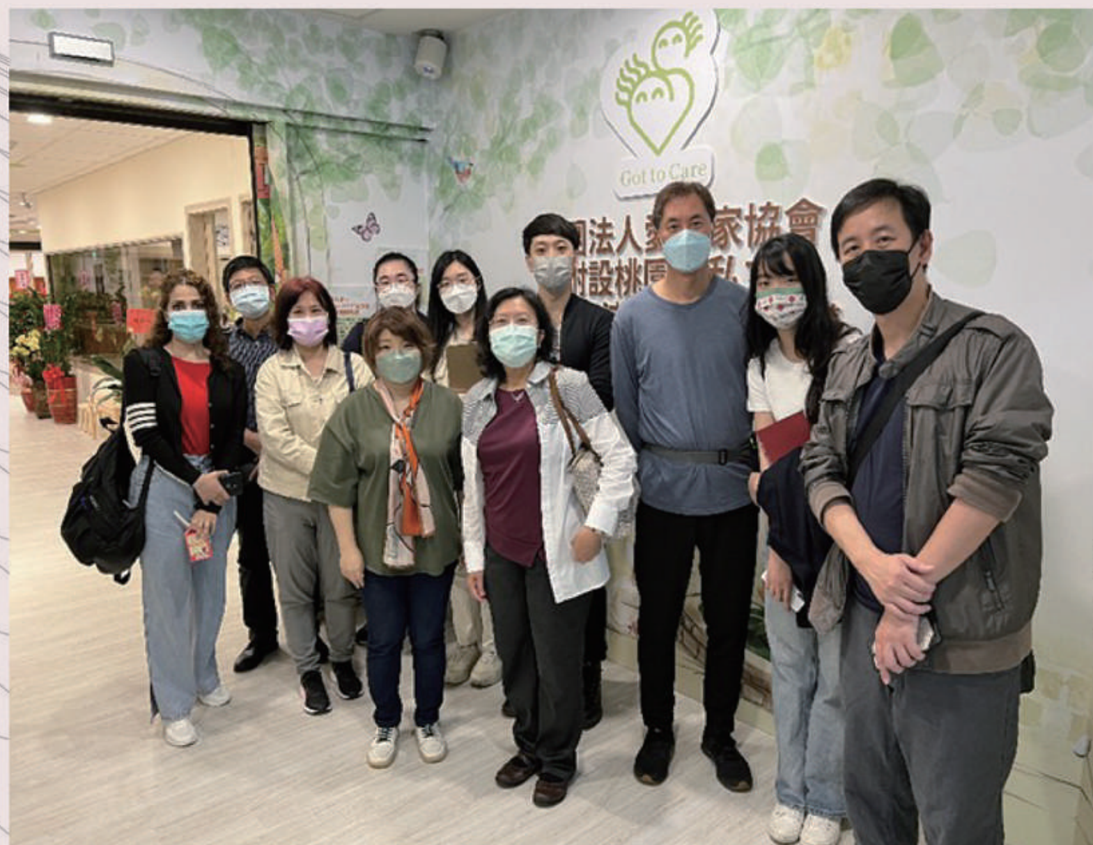
●桃園私立大滿社區長照機構參訪