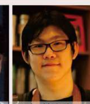
96年 曾中富 清代大甲城鎮空間變遷之研究-101年完成