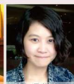
92年 吳依倫 清代台灣地區文昌廟的調查研究-95年完成