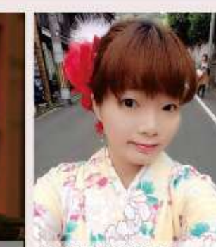
98年 黃淑珮 金門新建築運動的地域批判研究-進行中