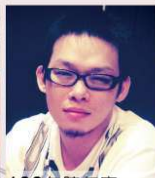
100年 陳仁豪 都市發展脈絡下板橋地區土地公廟變遷之研究-以埔墘福德宮為例-103年完成