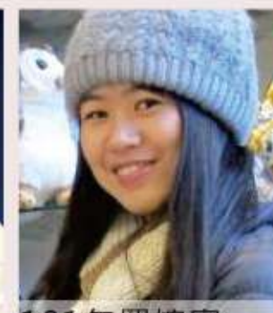
101年 羅婉寧 淡水河流域平埔族聚落變遷之研究-107年完成