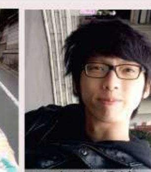
98年 蔡岳鈞 台灣日治時期佛寺納骨塔之研究-101年完成