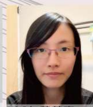
106年 黃慧真 日本時代淡水線之研究-111年完成