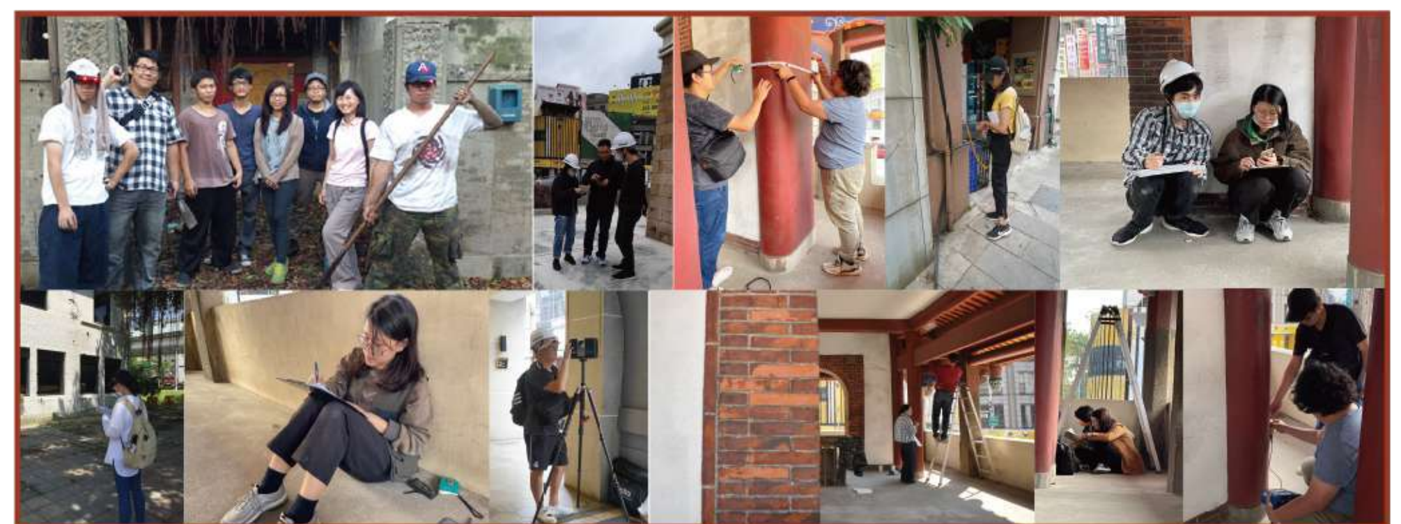
圖1 文化資產田野調查