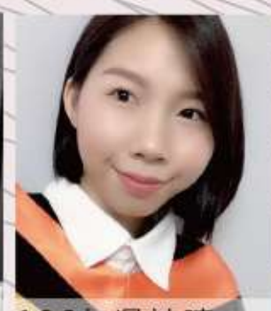
106年 吳詩晴 臺灣當代大神像寺廟建築之探討-108年完成