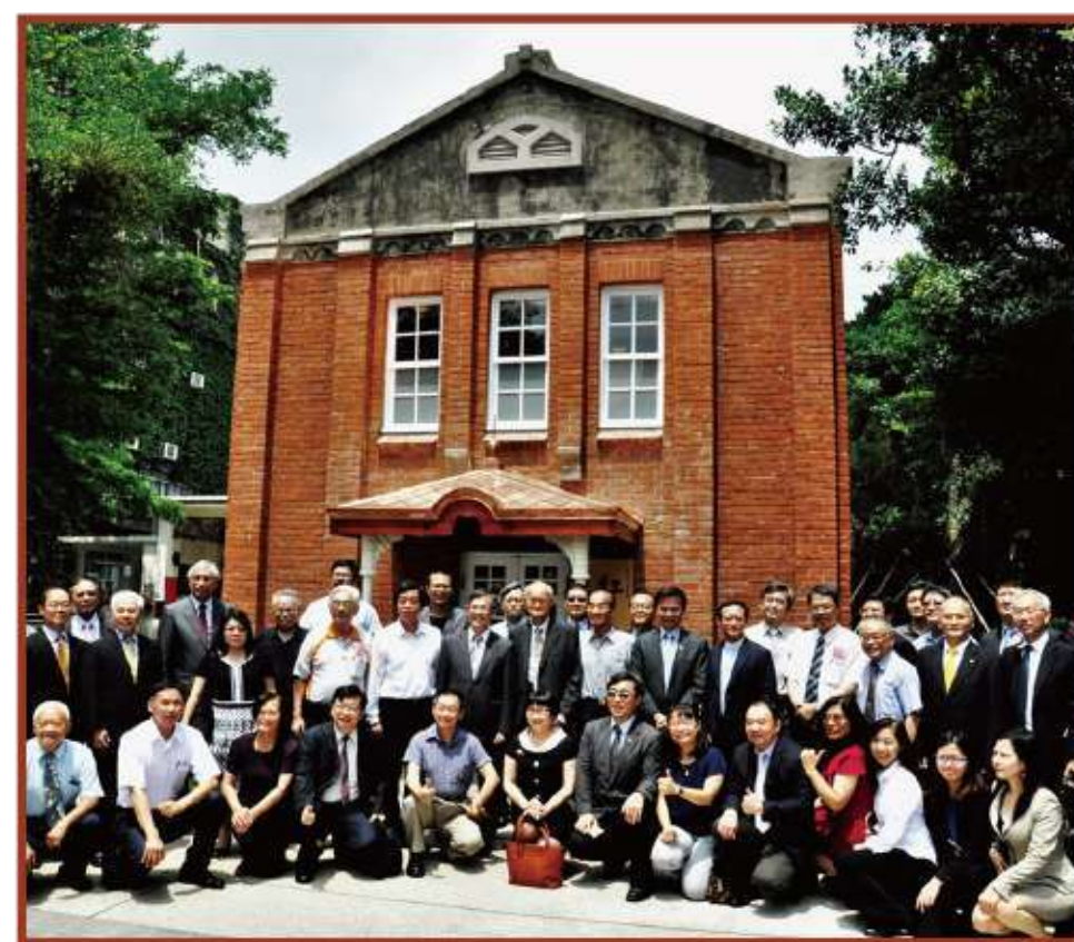
圖1 紅樓調研、設計、修復紀錄

十餘年來參與保存實踐各階段的實務研發工作，這過程中，積極嘗試建置屬於北科大建築團隊的特色研究方法與規範，期使走在台灣古蹟修復實務與理論的頂端，引領保存趨勢潮流。目前，在經歷過無數的計畫淬鍊與調整、修正下，包括古蹟調查研究及修復計畫、遺產記錄、管理維護計畫、因應計畫、工作報告書，都已經建置了專屬於北科特色的計畫規範與研究方法，其成果嚴謹、豐碩具學術特性。