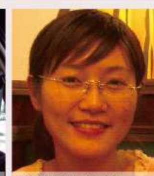
92年 陳心怡 台灣官祀關帝廟空間文化之研究-95年完成