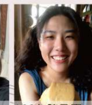
108年 陳乃翹 近代臺灣鐵路橋梁工程之文化研究-進行中