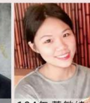
104年 黃敏綺 臺灣月老廟建築文化之研究-107年完成