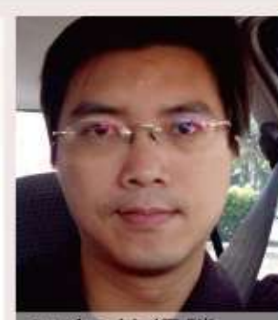
91年 林鈺勝 台灣一貫道佛堂儀式空間之研究-以發一崇德觀林道場為例-94年完成