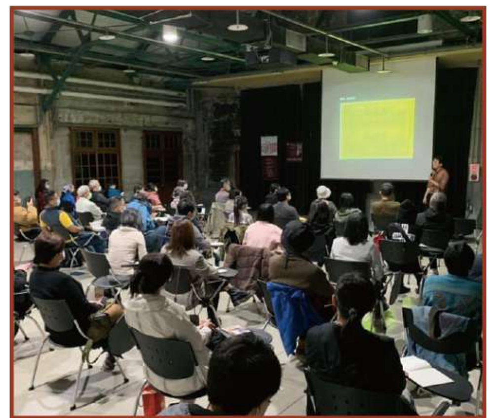
圖2 舉辦2020年文資游草論壇