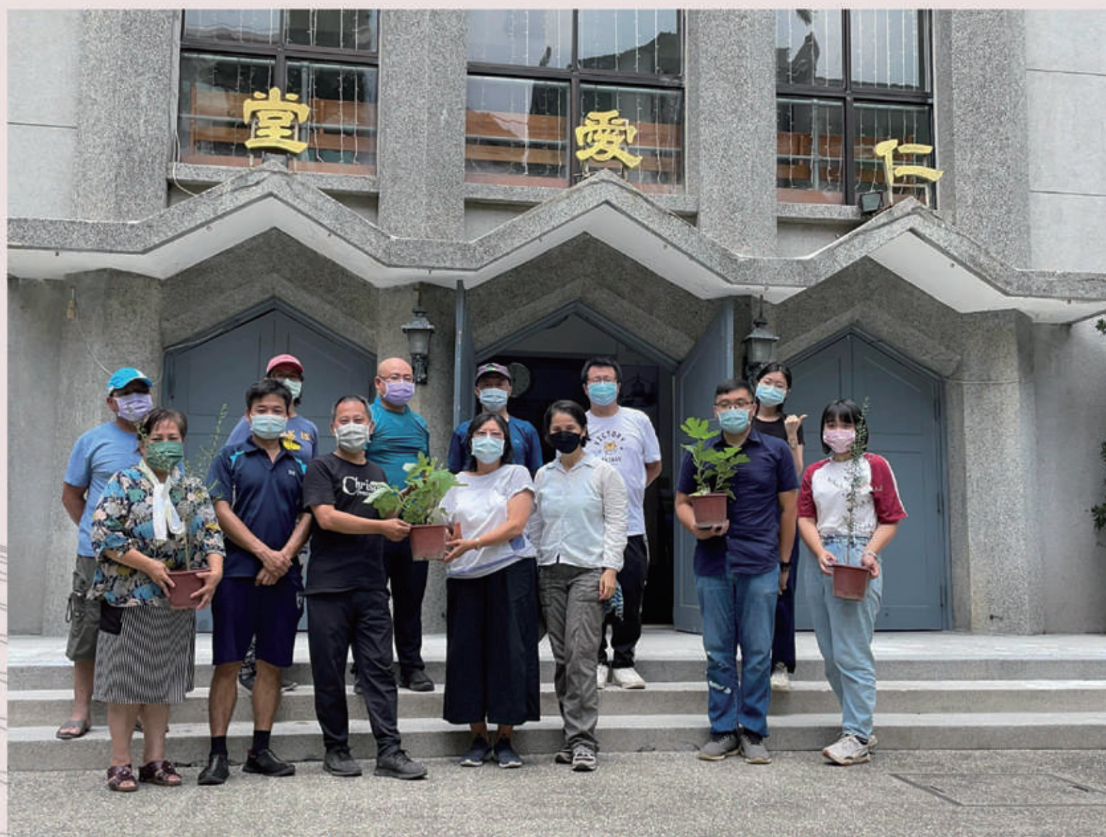
●療癒綠社區實作---教會療癒花園施工