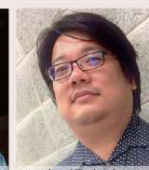
95年 楊甯堯 清代京畿與直省官祀建築空間之研究-99年完成