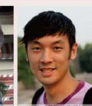
98年 張朝勛 臺北城內清代官署建築變遷之研究-102年完成