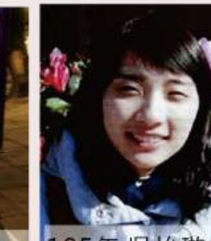
105年 吳怡璇 從文資法修法歷程看臺灣古蹟保存歷史變遷-109年完成