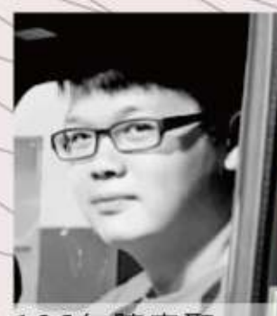
106年 陳家聖 臺灣雙忠信仰廟宇變遷研究-109年完成