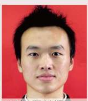
90年 王毓翔 清代新竹地區墳墓建築調查研究-93年完成