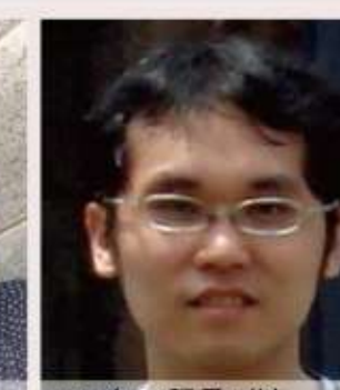
95年 邱聖傑 北台地區石匠張木成作品之研究-98年完成