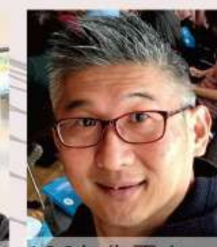
106年 朱正志 日治時期台灣天主教教堂建築研究-進行中