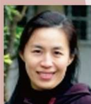
96年 曾尹君 馬偕博士在北港傳教空間的拓展-106年完成