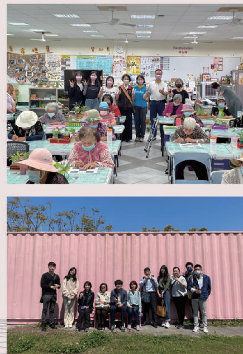
●研究室參訪合照-好好聚落參訪